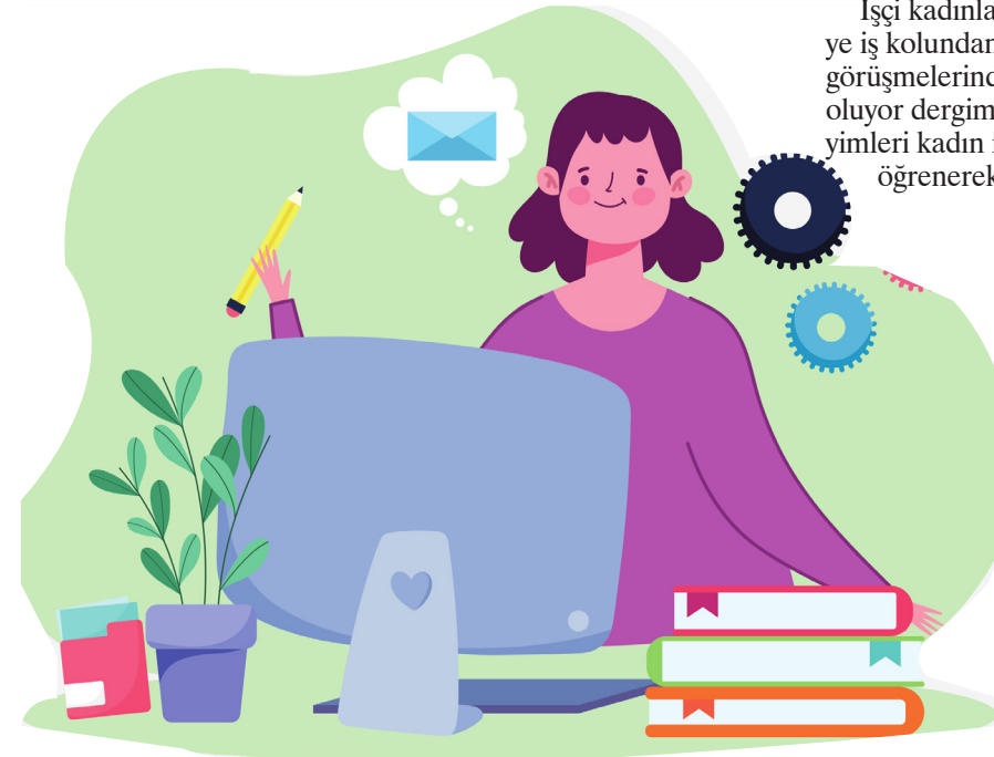
Kapak çizimi: Ekmek ve Gül (Kapak çiziminde kullanılan unsurlar: Freepik ve Icons8) - Sunu görseli: Canva