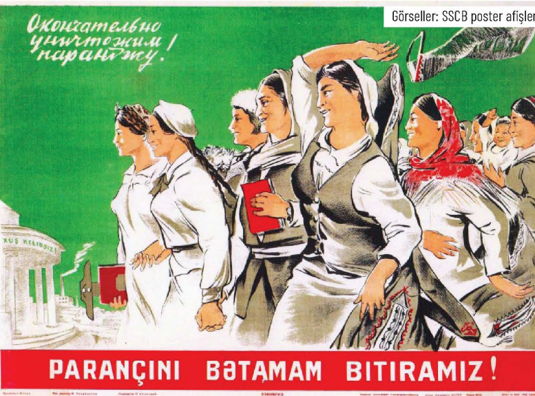
Görseller: SSCB poster afişleri

1921'de Jenotyel görevlisi kadınlar, propaganda trenleri ve gemileri ile Azerbaycan, Türkistan, Başkurdistan, Kırım ve Kafkasya'ya gitti ve konserler, konuşmalar ve posterler vasıtasıyla halk arasında propaganda faaliyetinde bulunuldu. Ancak Jenotyellerin Doğu'da çalışma yürütmesi hiç kolay olmadı. Okuma yazma oranının düşüklüğü, dini ve milli farklılıklarla ön yargılar, gelenekler ve erkek-