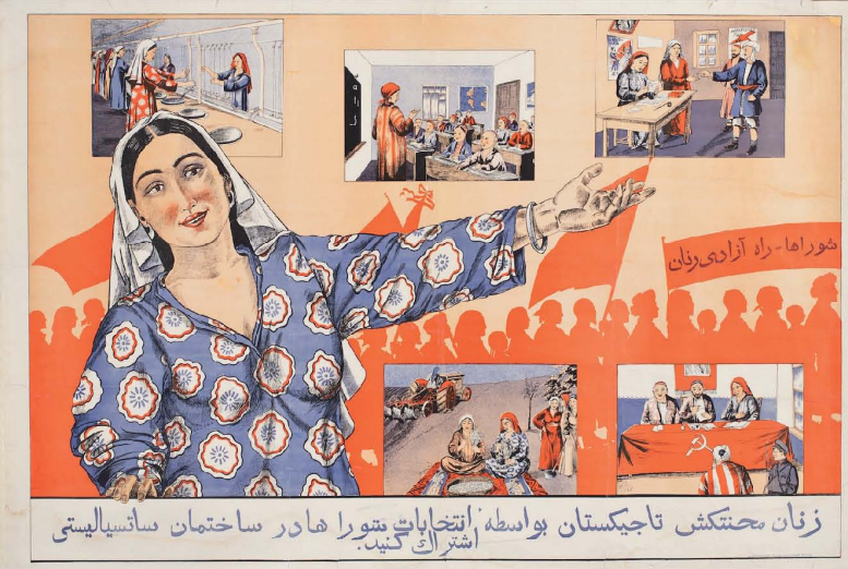
Зан ҳақиқатини таъқиб қилиш ва ҳақдорликни таъқиб қилиш. Тоҷикистон