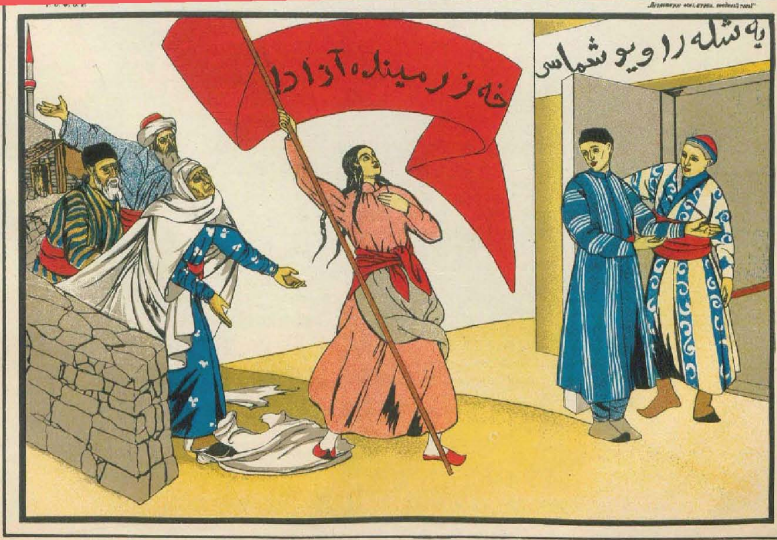
Неизвестный художник. Москва

Parti tarafından Jenotyel'e verilen görev; kadınlara yönelik yasal reform sürecinin denetlenmesi ve kadınların toplumun eşit birer üyesi haline getirilmesiydi. Öncelikli hedef; kadınların okuryazar hale gelmesi ve politik açıdan eğitilmesi oldu.