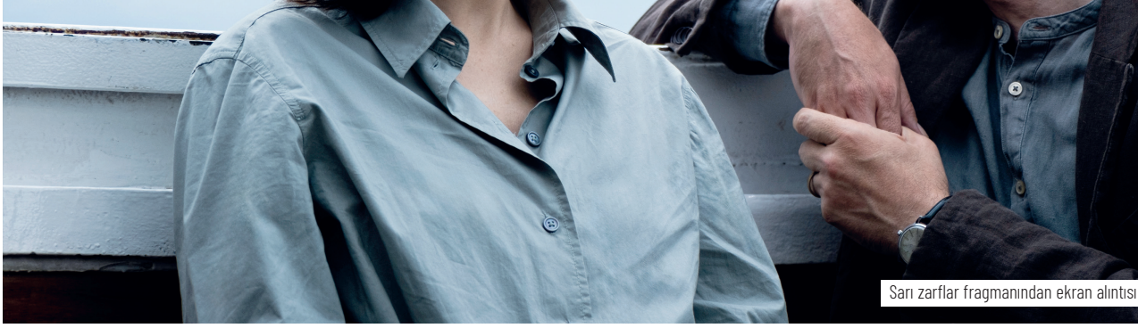
Sarı zarflar fragmanından ekran alıntısı