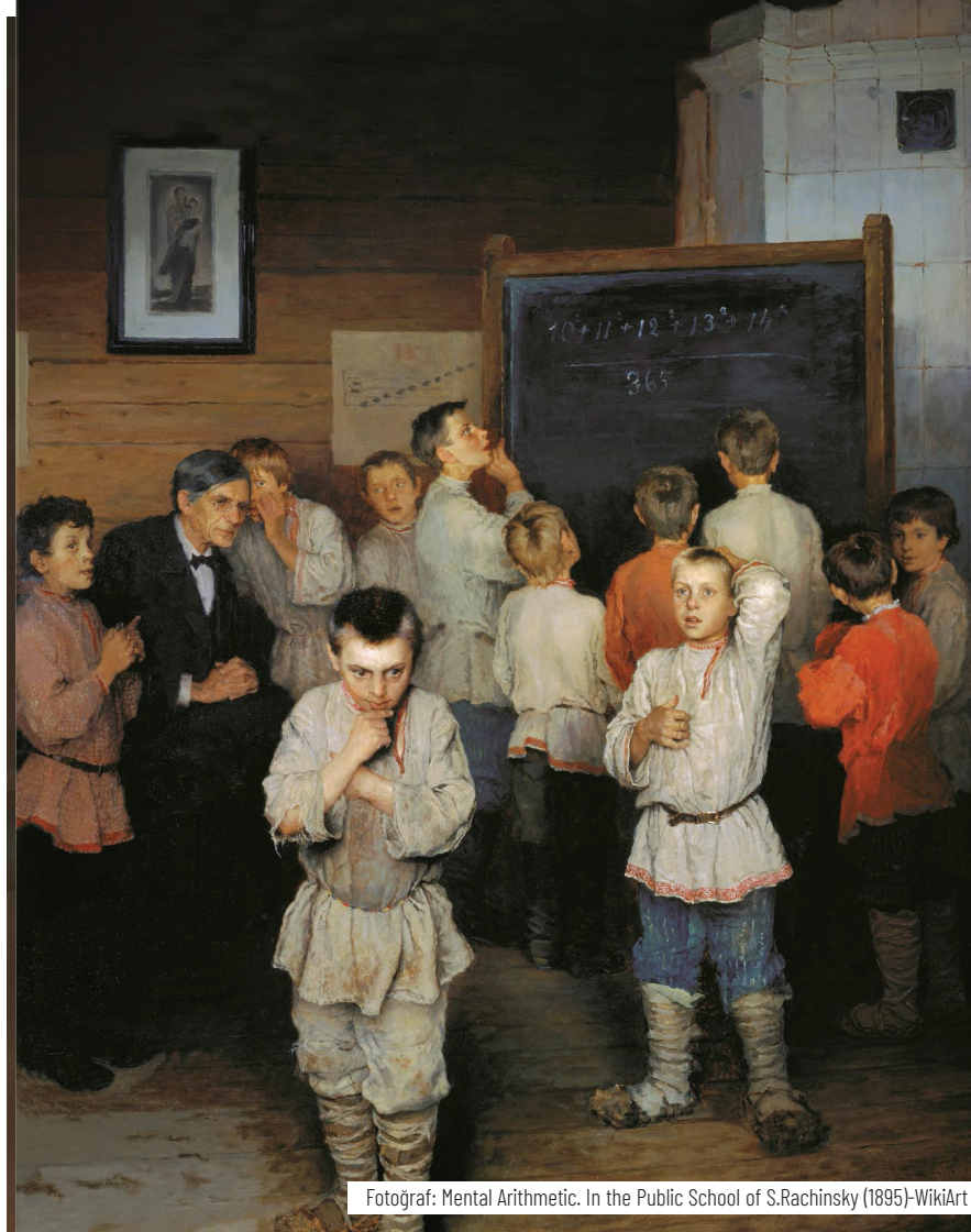
Mental Arithmetic. In the Public School of S.Rachinsky (1895)