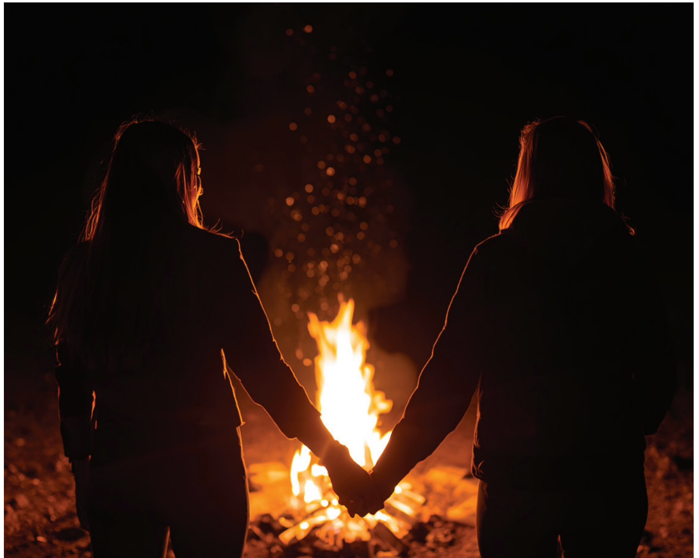
Kapak çizimi: Dilan Mine Uğurlu/Ekmek ve Gül | Sunu görseli: Canva pro yapay zeka

Kız kardeşim, elindeki yelpazeyi yanındaki kız kardeşine uzat. Uzat ki hayatlarımızı yakanların ateşini birlikteliğimizle söndürebilelim.