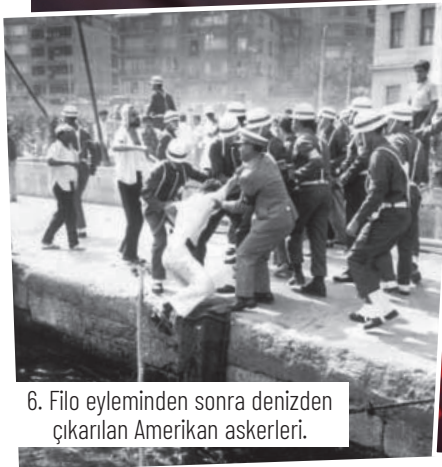
6. Filo eyleminden sonra denizden çıkarılan Amerikan askerleri.