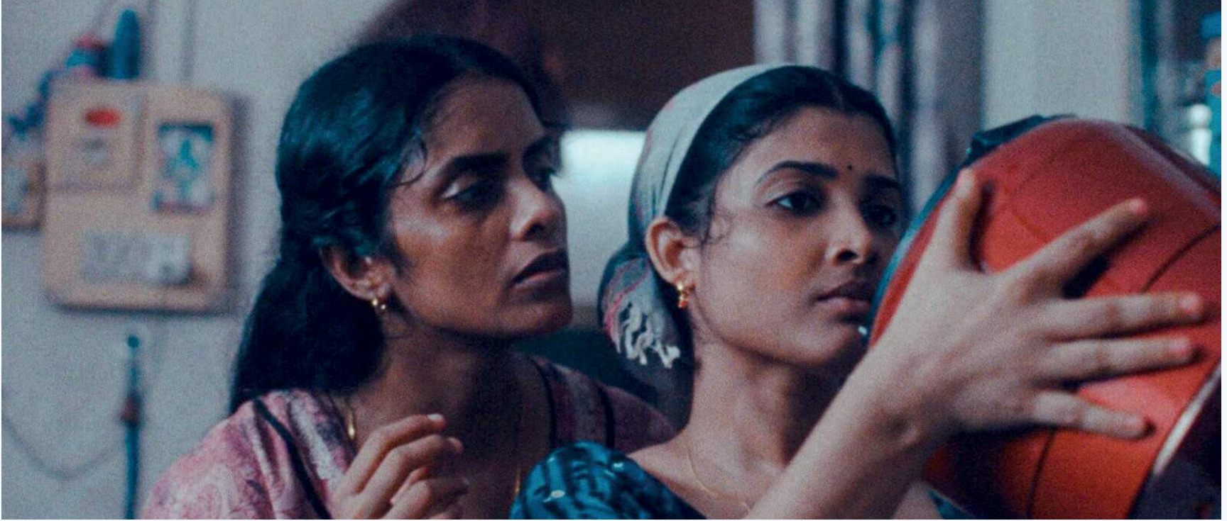
Fragmandan ekran görüntüsü alınmıştır