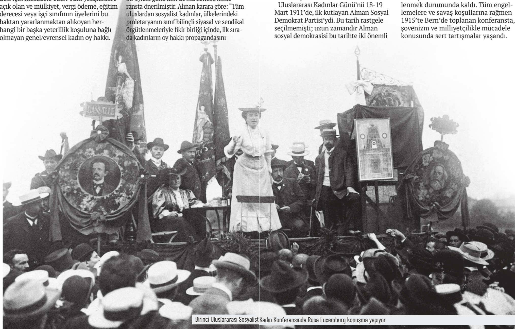
Birinci Uluslararası Sosyalist Kadın Konferansında Rosa Luxemburg konuşma yapıyor

Kandel, L., & Picq, F. (1982). Le mythe des origines, à propos de la journée internationale des femmes. La Revue d'en face, 12, 67-80. Kaplan, T. (1985). On the socialist origins of International Women's Day. Feminist Studies, 11(1), 163-171. https://doi.org/10.2307/3180144 (If available) Zetkin, C. (1921). Speech at the Second International Conference of Communist Women, June 9-15, 1921. Communist International. https://library.fes.de/zweiint/f20.pdf