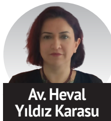
Av. Heval Yıldız Karasu

Yargı unsurlarının burjuva hukukuna bile riayet etmediği; Anayasa Mahkemesi (AYM), Danıştay ve Yargıtay içtihatlarının hiçe sayıldığı yani özetle yönetenlerin istediği gibi at koşturduğu bir mecrada; yargı eliyle ağaçları kesilen, dereleri kurutulmuş, ormanları yok edilen köylülerin, yaşamları hiçe sayılan LGBTİ'lerin, benlikleri ve yaşamları sayı ile ifade edilen kadınların, mağduru ve faili aynı sistemin kurbanı olan çocukların, cezasızlıkla ödüllendirilen iş cinayetlerinin ve daha nice sistem mağdurunun direnci elbette ki meşrudur.