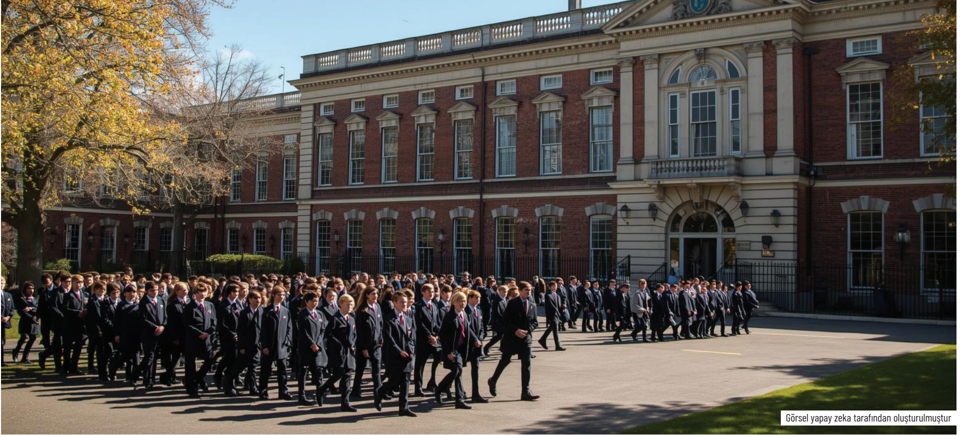
Görsel yapay zeka tarafından oluşturulmuştur