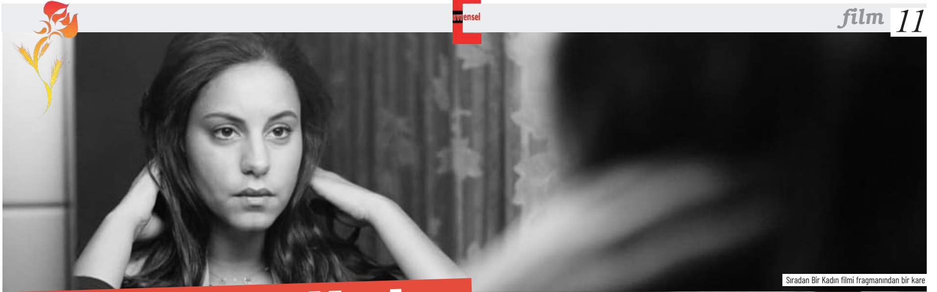
Sıradan Bir Kadın filmi fragmanından bir kare