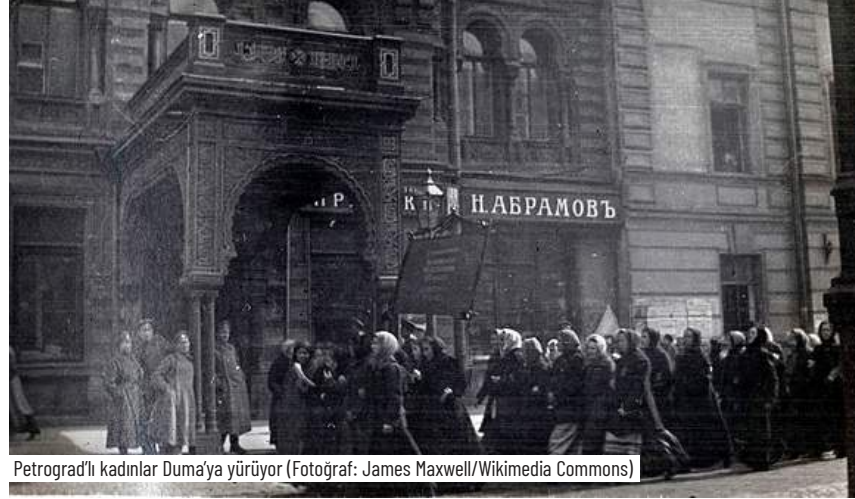
Petrograd'lı kadınlar Duma'ya yürüyor

Bunun yanında işçi ve emekçi kadınların sendikal örgütlenme haklarını kısıtlıyor, grevleri yasaklıyor, iş yerinde hakları için ses çıkartan örgütlenen kadınlara yöneltilen mobbing ve baskıyı görmezden geliyor. Geçtiğimiz günlerde Bursa'da Aunde Teknik Tekstil Fabrikasında bir kadın işçi