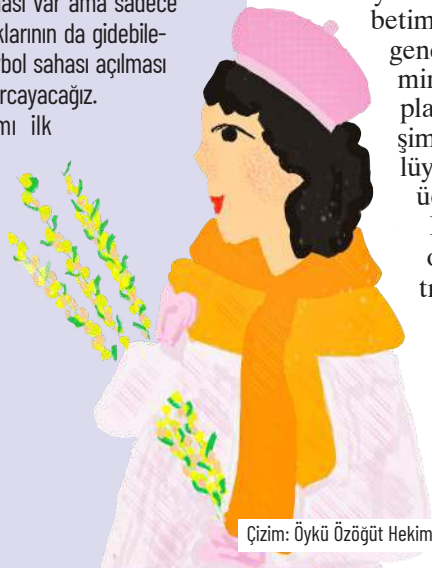
Çizim: Öykü Özögüt Hekim

"Peki nasıl bir belediye başkanının kazanmasını istersiniz?" diye sordüğümüzde ise kadınlar ortak bir cevap veriyorlar: Halkını düşünen ve halkı için çalışan, şeffaf, birilerine rant sağlamayan, gereksiz harcama yapmayan, kendi yandaşlarını korumayan, torpille işe alım yapmayan bir yerel yönetim anlayışı istiyorlar ve buna göre oy vereceklerini dile getiriyorlar.