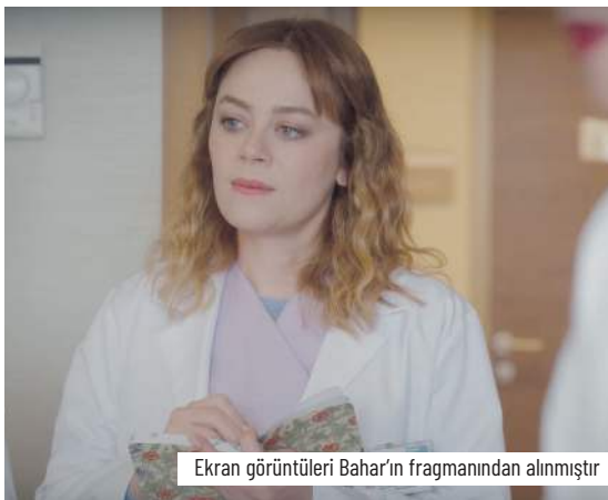
Ekran görüntüleri Bahar'ın fragmanından alınmıştır

Bahar bize ev içi angaryayı, çalışmayan bir kadın olarak yaşadıklarını anlatırken