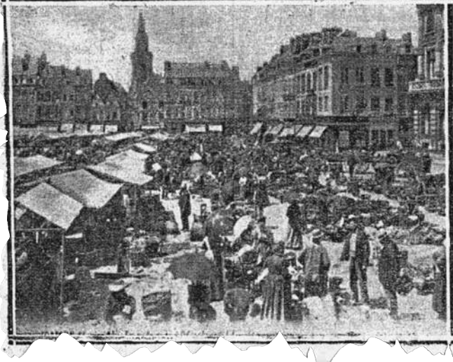
1911'de Fransa'da ev kadınların hayat pahalılığına karşı eylemlerinden günümüze ulaşabilmiş çok az belge ve fotoğraf bulunuyor. Bu gazete kupürleri de onlardan birkaçı

yonu CGT 1 Eylül'de Kuzey'de iki günlük genel grev ilan etti. 12 bin metalurji işçisi 48 saatlik greve çıktı. Özellikle kadınların tutuklandığı Hautmont'ta tüm fabrikaları durdurdu işçiler. Cezalar indirilse de olaylar durmadı. 6 bine yakın kişi Maubeuge'e doğru yürüyüşe geçti ve onları durdurmak isteyen jandarmayla karşı karşıya geldi. Artan şiddete rağmen ertesi güne kadar süren eylemler dinmeyince kolluk güçleri transferi yapıldı, yetkililer dışında komüne girişi engellemek için asma köprüler kaldırıldı. Diğer komünlerde de durum hemen hemen aynıydı. İşçiler greve çıkmış, kadınlara katılıp yürüyüşler düzenliyor, askerlerse engellemeye çalışıyordu.