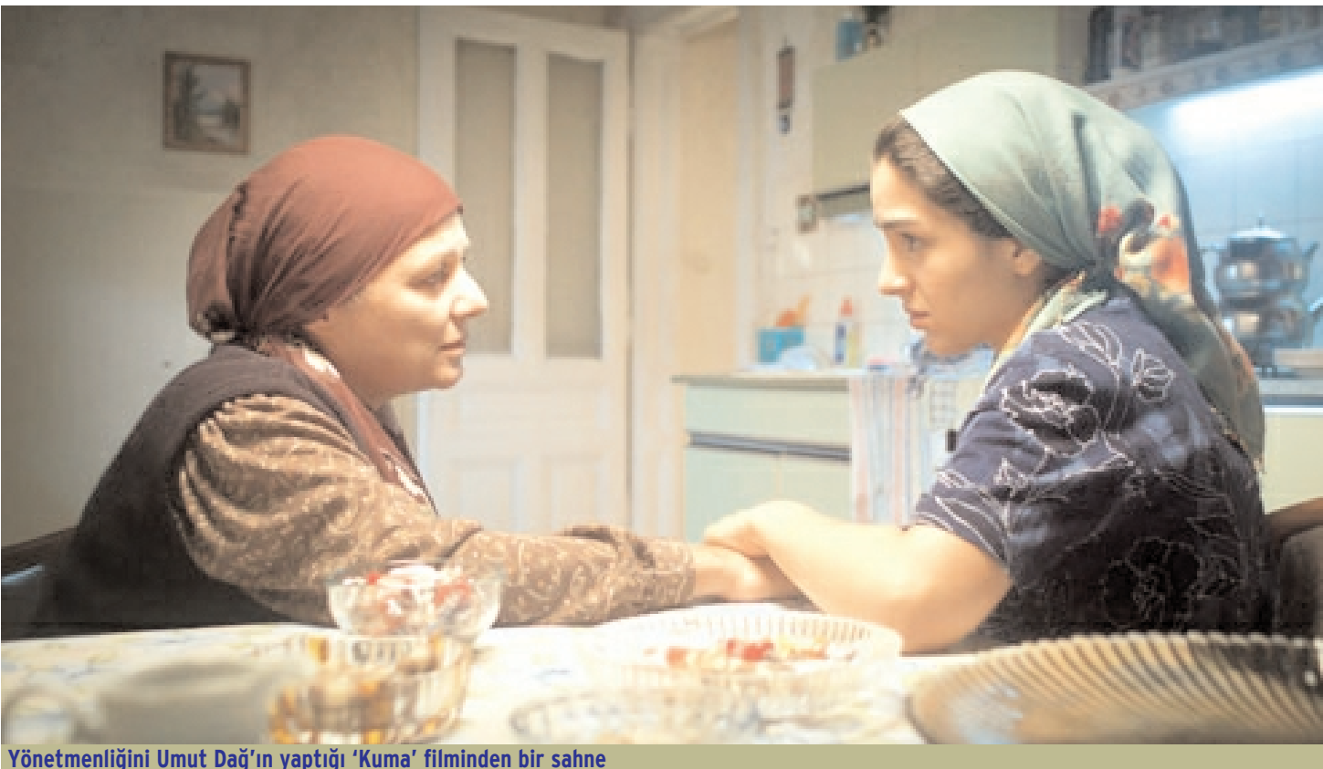
Yönetmenliğini Umut Dağ'ın yaptığı 'Kuma' filminden bir sahne

Çocuk yaşta genç kadınların evlendirilmeleri de çokkadınlılığı yaygınlaştırır; yasal evlilik yaşına erişmemiş kızları kuma olarak "kayıt dışı" evlendirmek, çocuk evliliklerine ve evlilik yaşına dair yasal engelleri aşmak demektir. Genç kadınlar böylelikle hane idaresini ilk eşin himayesinde öğrenir, erken yaşta başlayan doğurganlığıysa hane nüfus artışını garantiler. Erkekler arası gelir uçurumunun yaygın olduğu çevrelerde başlık uygulaması yaygındır, aileler kızlarının ikinci eş olmasını önemsemekten başlık için, varlıklı ailelere kuma olarak evlendirirler. Engelli genç kadınların başlıklarının düşüklüğü nedeniyle kuma olarak tercih edildiğini biliyoruz. ▶▶▶