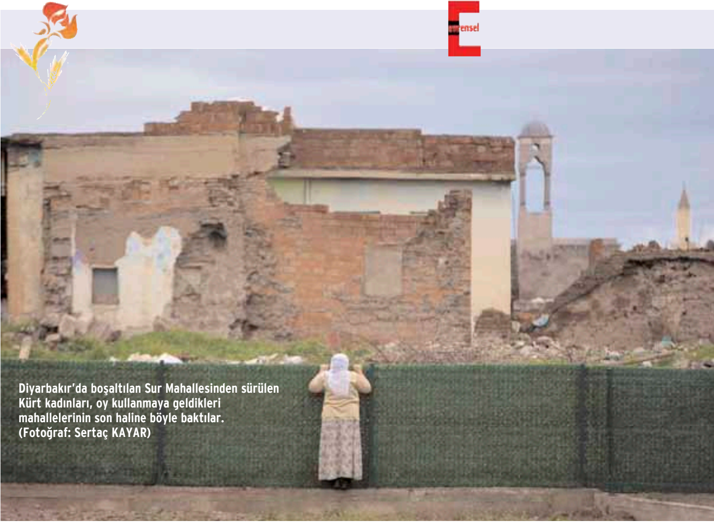
Diyarbakır'da boşaltılan Sur Mahallesinden sürülen Kürt kadınları, oy kullanmaya geldikleri mahallelerinin son haline böyle baktılar.

Bu seçim iki Rabia arasında bir seçim olarak anılacak: Tek Adam'ın tüm adaletsizliklerin üstünü örtmek için kullandığı "tek millet, tek bayrak, tek vatan, tek devlet" rabiası bir yanda, AKP'li belediye başkanının yeğeninin öldürüp AKP'li bakanın cinayeti örtbas ettiği, zenginin adaletinin emekçiye zulüm olduğunu anlayan Giresun Eynesil'in Rabiası tam karşısında.